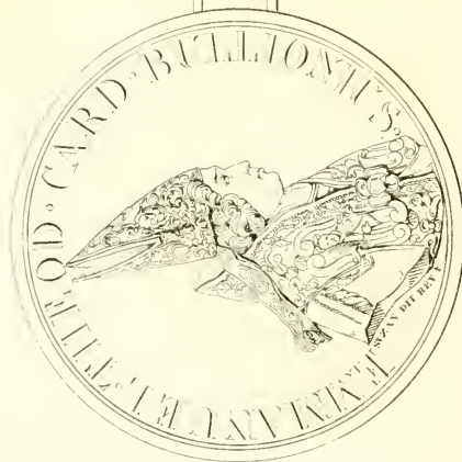
Vermand, fils de et comp